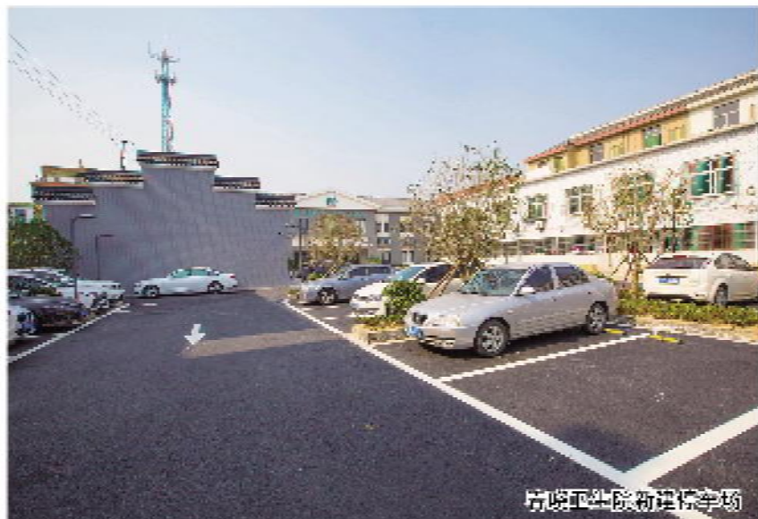
新建的春晓街道新建学校

把综合整治作为小城镇环境综合整治的抓手，充分依靠和利用社居委力量，由村社书记任组长，整合村居